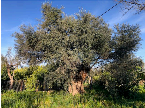
Unsere Farm vor und nach dem Aufräumen

Jedwede Chemie (in griechisch beschönigend „Pharmaka“ genannt) kommt uns nicht in unseren Garten! Auch dadurch wollen wir ein Zeichen setzen.