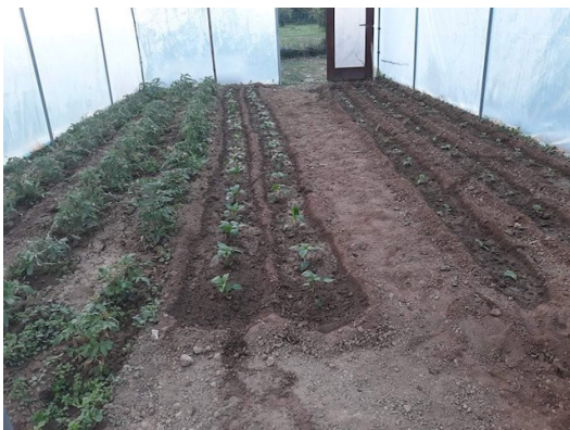
Griechenland Hilfe, die ankommt e.V.

Raiffeisen-Volksbank, Neuburg an der Donau, BIC: GENODEF1ND2, IBAN: DE33721697560000958700