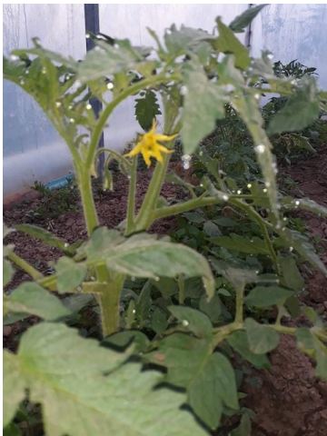
Die ersten Tomaten wachsen im neuen Gewächshaus

Infolge des Ausgangsverbotes benötigen unsere Farmarbeiter eine Ausnahme-Genehmigung von der Polizei. Diese konnten wir mit gutem Zureden erreichen, das Argument, dass Tiere versorgt werden müssen, hat endlich überzeugt.