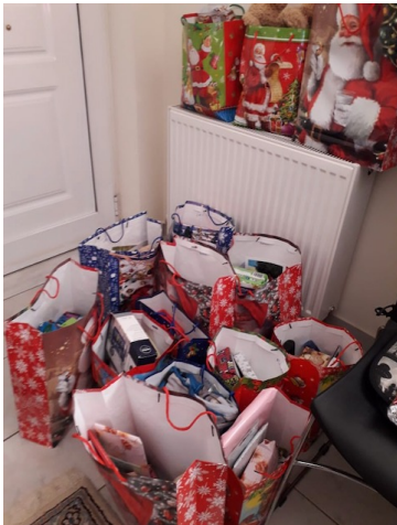
Die Tüten sind vorbereitet.