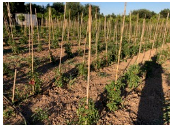
Junge Tomatenpflanzen für die zweite Ernte.

Unsere neue Farm begeistert uns alle. Die vordere Hälfte, mit Citrus-Bäumen und Olivenbäumen bestanden, wurde von uns komplett saniert. Das hohe Gras wurde gemäht und alle Bäume neu beschnitten. Als Dank sagte uns der Besitzer zu, dass die Hälfte der Ernte uns gehören würde. Jetzt können wir uns auf Zitronen, Orangen und Bitter-Orangen freuen. Was wir mit den Oliven machen werden, ist noch nicht beschlossen. Schon nach 2 Monaten wurde uns stolz der erste geerntete Romano-Salat und die jungen Zwiebelschloten gezeigt.